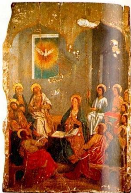
Pentecostés. Catedral de Zamora. Siglo XV

Escuchar la palabra, compartir la fracción del pan (eucaristía) y vivir el amor fraterno eran actividades esenciales de las primeras comunidades cristianas. Para ello, necesitaban un lugar donde reunirse. Primero fueron las casas particulares, después el templo. Como el templo grecorromano no era adecuado porque servía sólo para guardar la estatua del dios y el culto se celebraba en el exterior, para estas reuniones los templos clásicos fueron sustituidos por edificios que podían albergar a mucha gente: las basílicas.