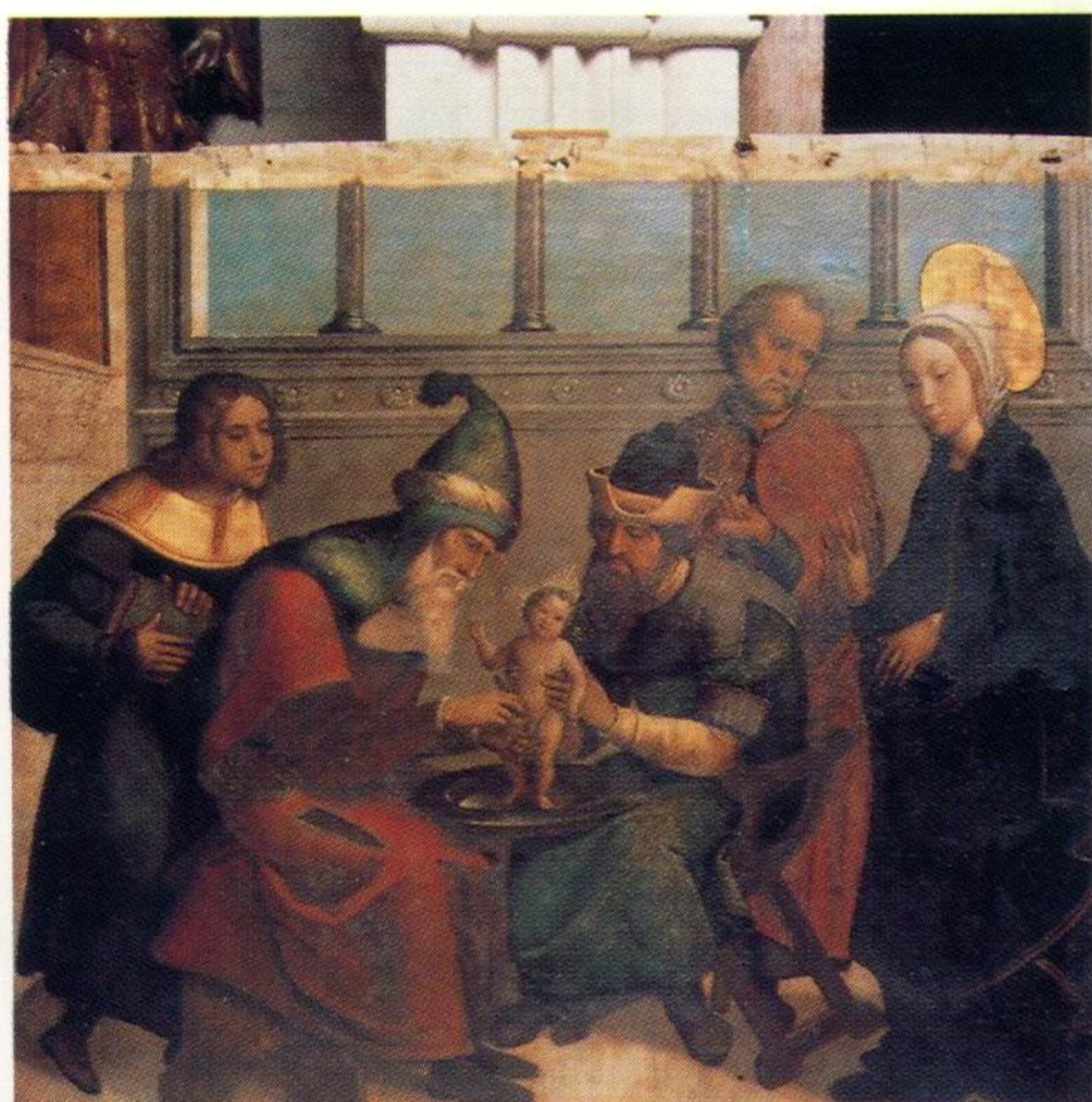
Circuncisión. Juan de Borgoña