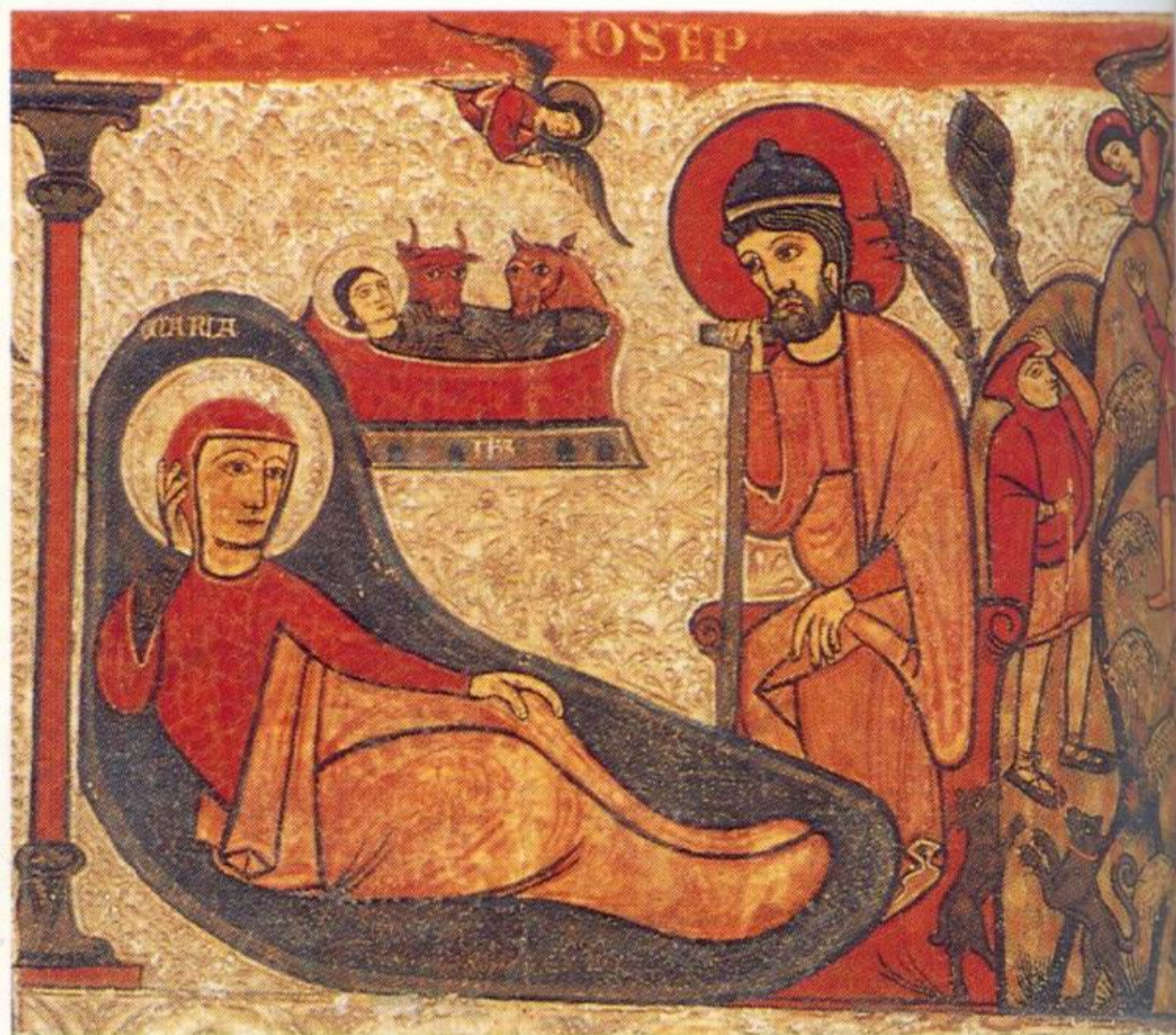
Nacimiento. Pintura románica catalana. Siglo XIII