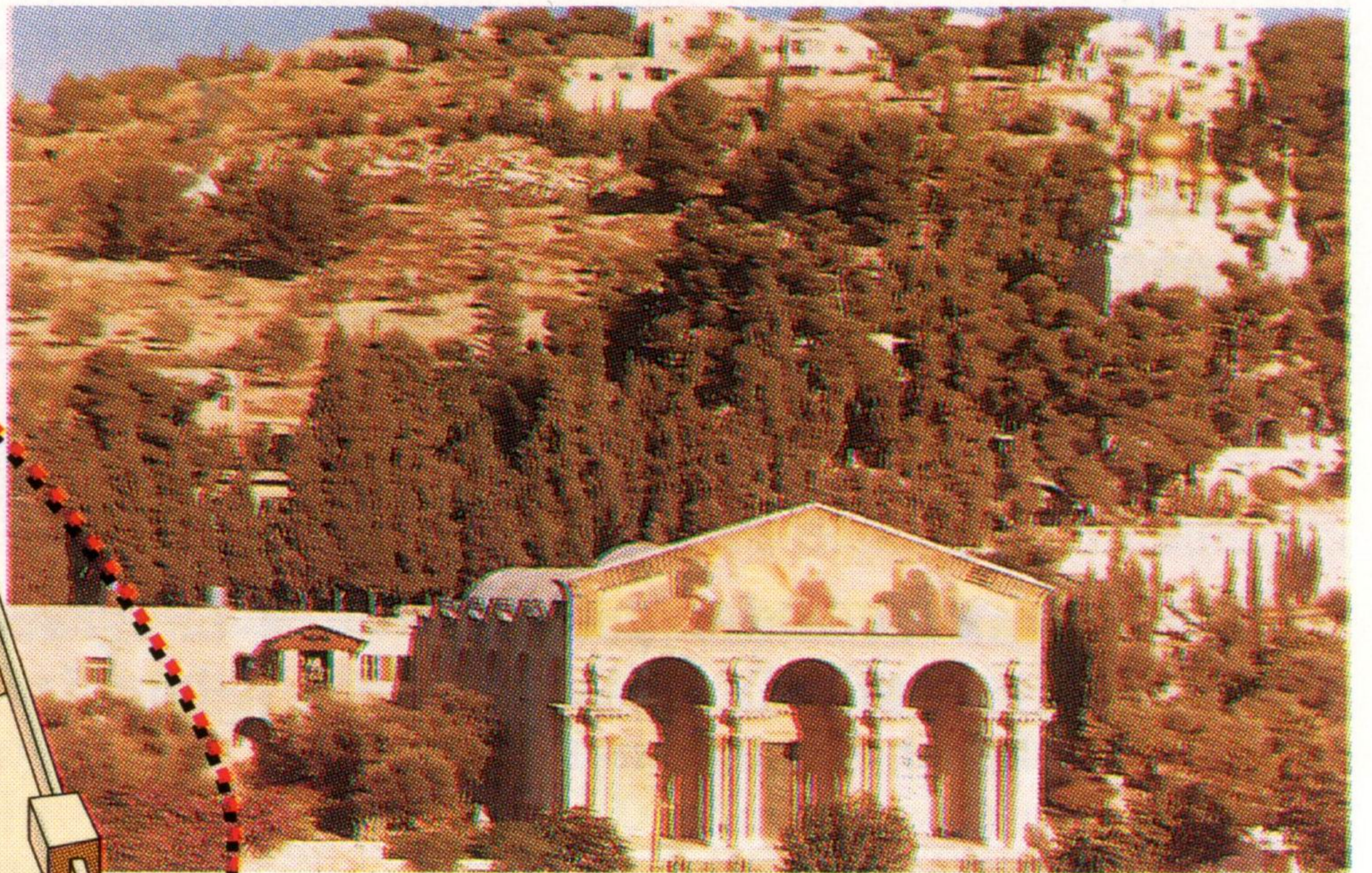
Getsemaní en la actualidad

Ruta probable desde Getsemaní hasta la crucifixión