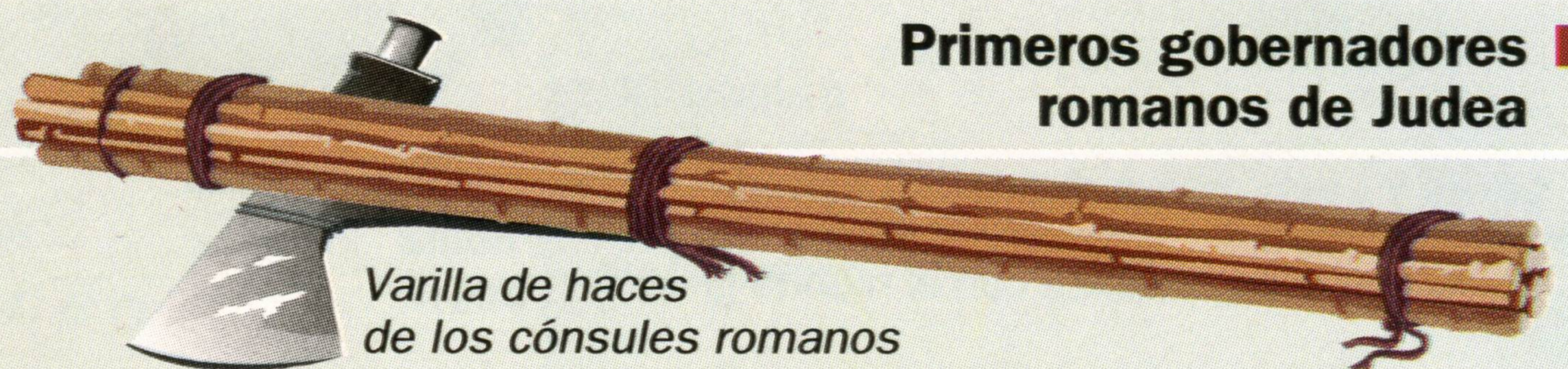
Varilla de haces de los cónsules romanos