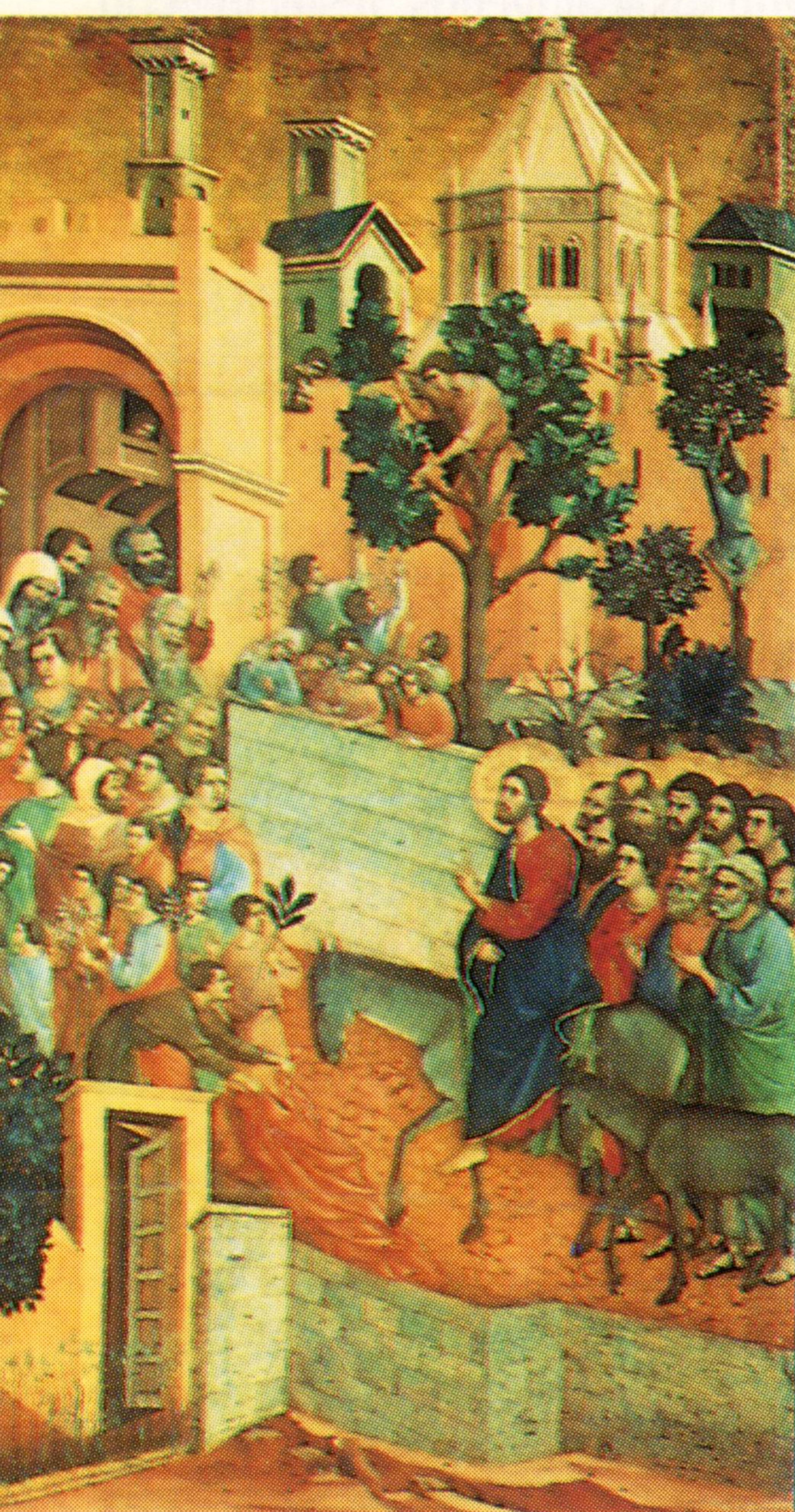
Entrada en Jerusalén. Duccio di Buoninsegna