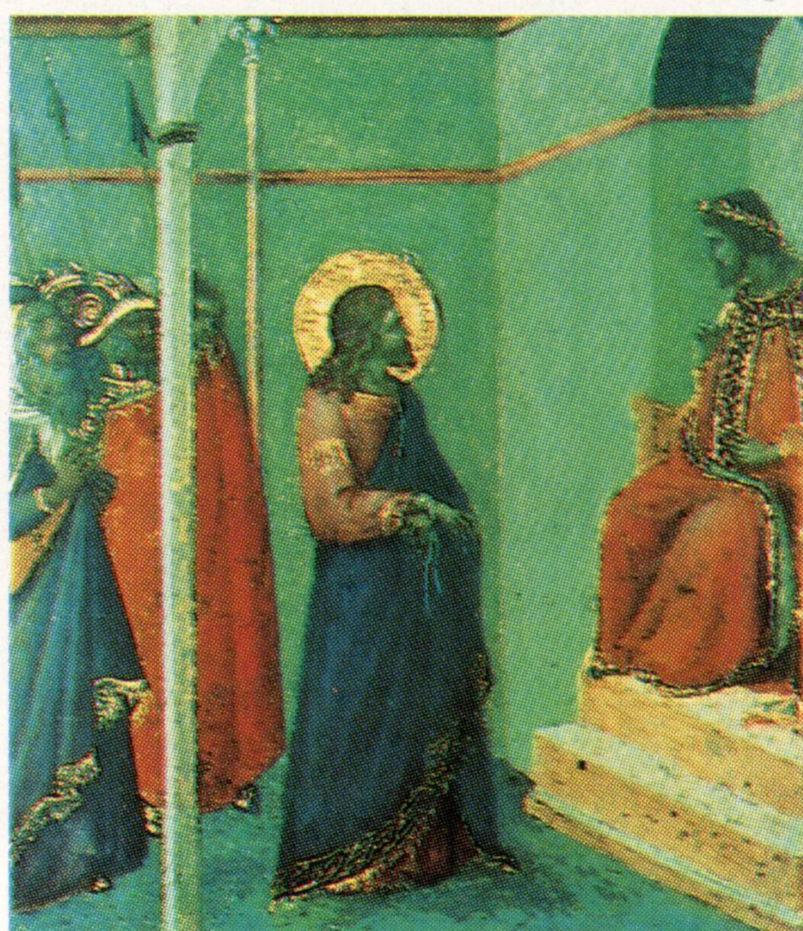
Jesús delante de Pilatos. Pietro Lorenzetti

Entrada triunfal en Jerusalén Jesús es aclamado como "rey" Expulsa a los mercaderes del templo Es identificado como Mesías por parte del pueblo judío